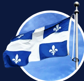
Indépendance du Québec