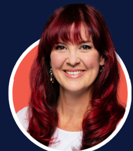
Travail de la députée