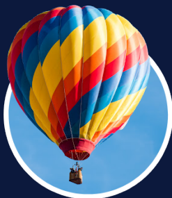
Nouvelles de la circonscription