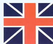
Ancien Union Jack anglais

En septembre 1759, l'armée britannique remporte la bataille des Plaines d'Abraham. L'Union Jack anglais remplace le drapeau blanc du roi de France sur les remparts de Québec. En 1774, les treize autres colonies anglaises d'Amérique se rebellent contre la Couronne britannique. En octobre 1774, ils invitent, sans succès, les habitants de la vallée du Saint-Laurent à se joindre à eux. En septembre 1775, les Américains assiègent le fort Saint-Jean. Saint-Jean résiste une quarantaine de jours. Le 12 novembre, Montréal capitule. Dans la nuit du 31 décembre, affaiblis par le long siège de Saint-Jean, les Américains tentent un assaut infructueux contre Québec. Les Américains évacuent finalement à la fin de juin 1776. Pendant sept mois, le Grand Union Flag américain a flotté officiellement sur notre région et une bonne partie du Québec.