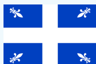
Drapeau de Carillon