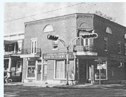
L'abbé Elphège Filiatrault est né à l'angle nord-est de la 1 re rue et de la 5 e avenue à Saint-Athanase (Saint-Jean-sur-Richelieu), le 27 novembre 1850. Un parc porte d'ailleurs son nom tout près, sur le bord de la rivière Richelieu, face à l'église Saint-Athanase.

En 1903, des comités sont formés au Québec pour l'étude d'un drapeau national. Les membres ajoutent au drapeau de l'abbé Filiatrault une image du Sacré-Cœur entourée de feuilles d'érable. Ils l'appelèrent le Carillon-Sacré-Cœur. La présence d'un emblème religieux sur le drapeau contribue cependant à entretenir des hésitations. En 1935, pour favoriser l'adhésion, on propose la suppression du Sacré-Cœur. L'idée gagne des appuis au grand dam du clergé. Dès lors, il commence à se faire appeler : « fleurdelisé ».